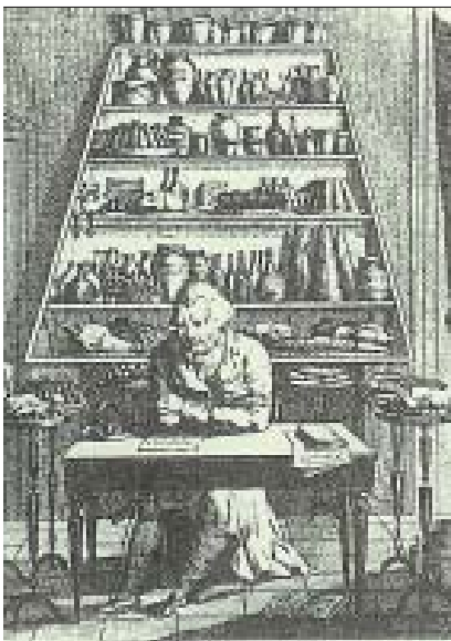
Meditationen eines Gourmets

Der passionierte Koch wählt Zutaten, Beilagen und Leckerbissen aus unterschiedlichsten kulturellen und kulinarischen Zusammenhängen aus und lernt, auch disparat und unvereinbar Erscheinendes zu einem ausgewogenen und schmackhaften, aber auch kontrastreichen Menu zu verbinden. 18 Und die bewirteten Gourmets werden es sich auf der Zunge zergehen lassen. Doch er wird bei dem einmal gelungenen Arrangement nicht stehen bleiben, er wird neugierig bleiben, wird sich offen halten für neue reizvolle Kombinationen, raffinierte Verfeinerungen, überraschende Zaubereien, immer wieder neu fein aufeinander abgestimmte geschmackliche Köstlichkeiten.