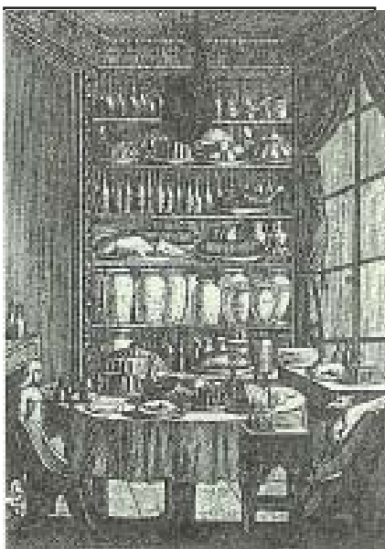
Bibliothek eines Leckermauls

Es ist eine hohe Kunst, für geladene Gäste ein harmonisches Menu zu kreieren: zunächst Ideen für die farbige Komposition der einzelnen Gänge zu entwickeln und das Wissen um die Eigenarten und Vorlieben der Gäste in diese Ideen einfließen zu lassen, dann die verschiedenen Zutaten auszuwählen, zuzubereiten und miteinander zu kombinieren, zu kosten und abzuschmecken, eventuell Zutaten zu ergänzen, Gewürze und Ingredienzen hinzuzufügen, die Kontraste zu überprüfen, passende Getränke auszuwählen, dann schließlich den einzelnen Gängen den letzten Pfiff zu geben und den Gästen den Gaumenschmaus zu servieren. Wesentliche Vorentscheidungen dafür fallen schon bei der Auswahl der Grundelemente: Einkaufen beim Direktvermarkter, biologisch dynamisch, oder im Supermarkt, ausländische Spezialitäten vielleicht oder Ernte aus dem eigenen Garten, vielleicht aber auch einfach auf das zurückgreifen, was die Speisekammer noch zu bieten hat. Wesentliche Vorentscheidungen für das Menu fallen in der Tat schon hier. Manchmal bestimmt die Idee vom Menu entscheidend die Auswahl, manchmal - und das nicht nur bei Anfängern 1 - trifft das „Man nehme...“ des Rezeptbuchs eindeutige Festlegungen, manchmal - und das nicht nur bei erfahrenen Köchen - wird die Auswahl auch ganz intuitiv getroffen und der Menuplan entsteht wie von selbst aus den ausgewählten Elementen. Wie auch immer, das Auswählen und das Verbinden der Zutaten bilden gemeinsam